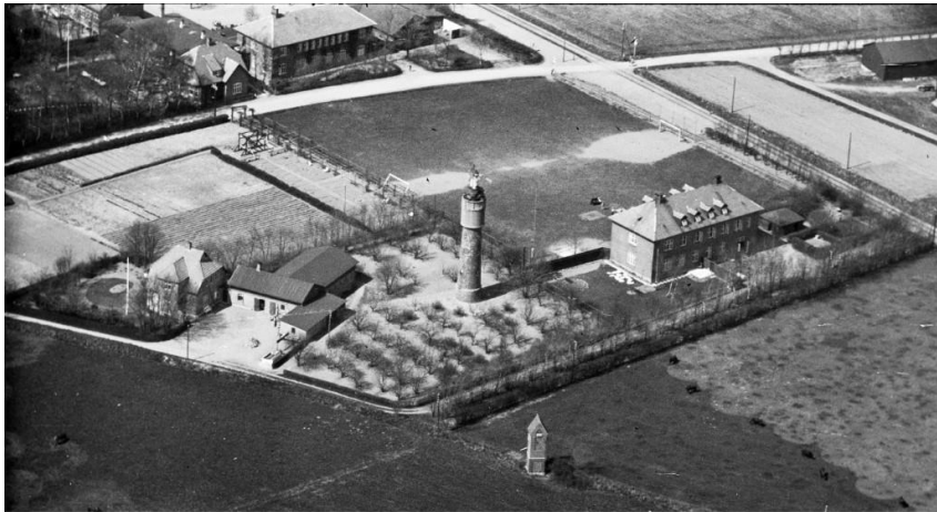
Godhavn 1936-38

“Plejefar var nok streng, men han var alligevel god – og frem for alt retfærdig mod os, og så levede han aldrig selv bedre, end vi drenge gjorde”