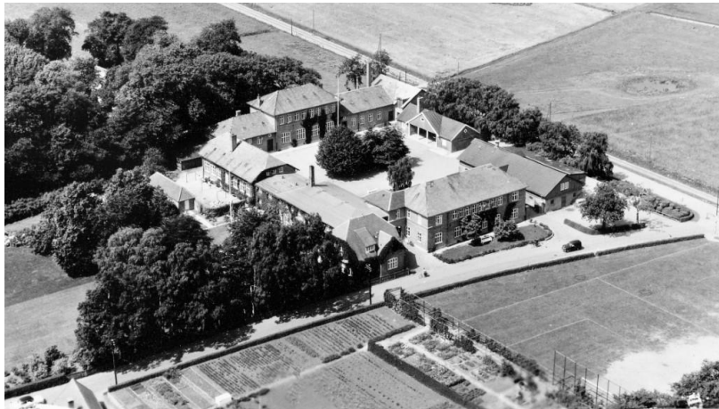
Godhavn 1953

Deltagelse og undervisning i idræt og boldspil foregår i starten på skolens egne arealer og skolens egne lærere, og skolen deltog i turnering under SBU med eget fodboldhold, men efterhånden som skolen åbner sig mere op mod det omliggende samfund, begynder børnene at dyrke sport i de omkringliggende klubber, og de