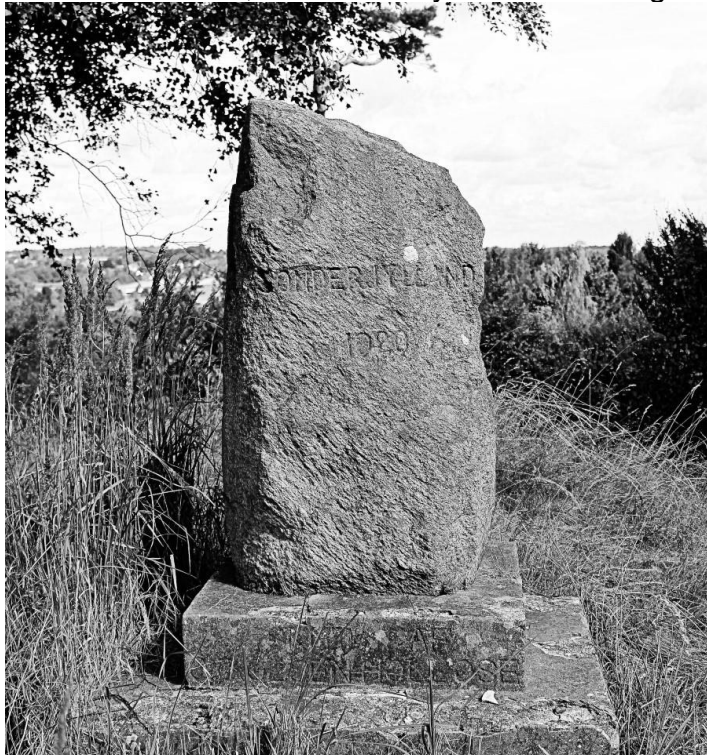
Genforeningssten på Ørby Baun

Borgerne i Vejby Sogn deltog også med en velkomsthilsen og rejste denne sten på Ørby Baun. Ved afsløringen af stenen den 20. juli 1920 talte Provst Haagen Müller og en veteran fra 1864 afslørede stenen, der var indhyllet i dannebrogssflag før afsløringen