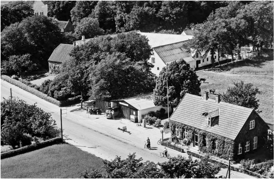
1956 - Frederiksværksvej 118, Ramløse