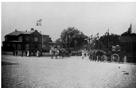
Optog ved Tinghuset i Helsingø