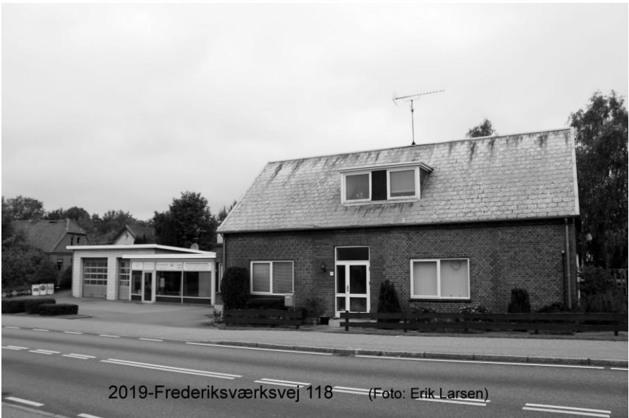
2019-Frederiksværksvej 118