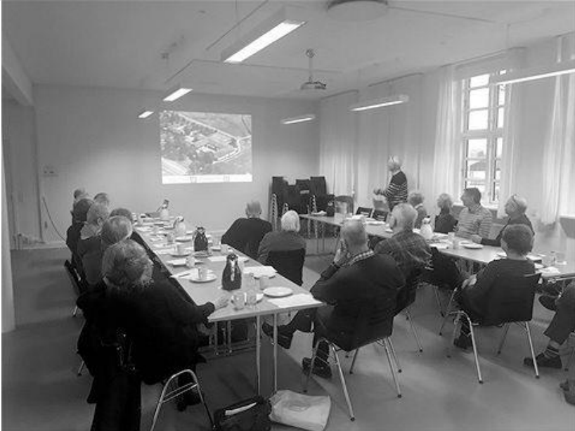
Fra Generalforsamlingen 1. februar 2020