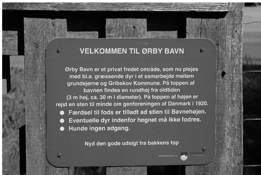
Skilt på lågen ind til Ørby Bavn

Indtil kommunalreformen i 1970, hvor antallet af kommuner blev reduceret fra 1098 til 271, hørte Ørby til Vejby-Tibirke Kommune. I 1970 kom Ørby under Helsingør Kommune, og ved strukturreformen i 2007 hvor antallet af kommuner i Danmark blev reduceret til 98, blev Helsingør og Græsted-Gilleleje Kommune slået sammen til Gribskov Kommune, og Ørby kom nu til at ligge i Gribskov Kommune, hvor byen forhåbentlig kommer til at ligge i rigtig mange år fremover.