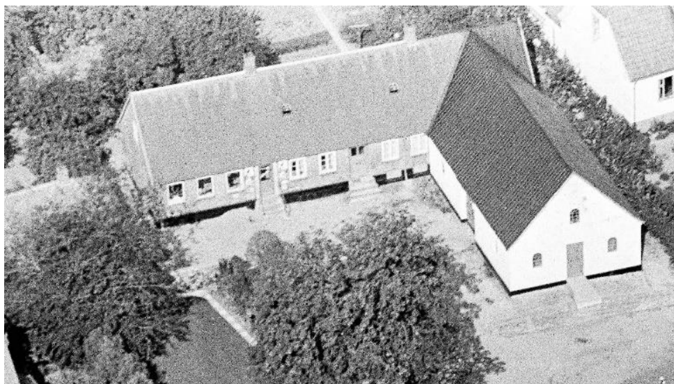
Ørby Købmandshandel 1949