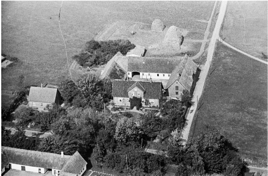
Attelund 1949 - En af Ørbys store gårde