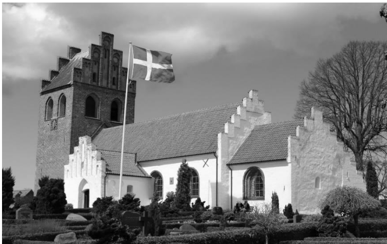
Helsingø Kirke anno 2018