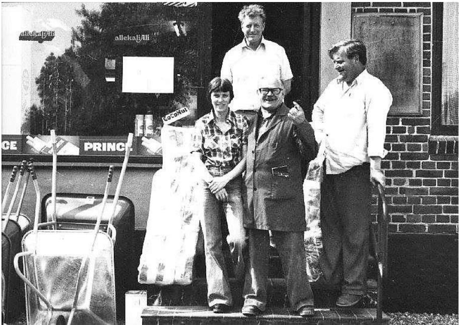
Købmanden i Ørby (th) med personale

Ørby har i mange år været en velfungerende landsby med et samfund, der har været bygget op omkring det lokale mejeri, Ørekilde Mejeri. Landmændene leverede deres mælk til mejeriet, og helt frem til 1978 kunne de aflægge besøg hos den velfungerende købmand midt i Ørby.