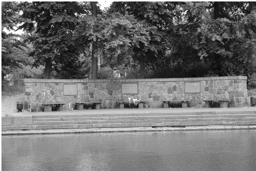
Mindemuren 2018

Men hvem var denne Christiern Pedersen? Hvorfor er der rejst en mindemur for ham i Helsinge?