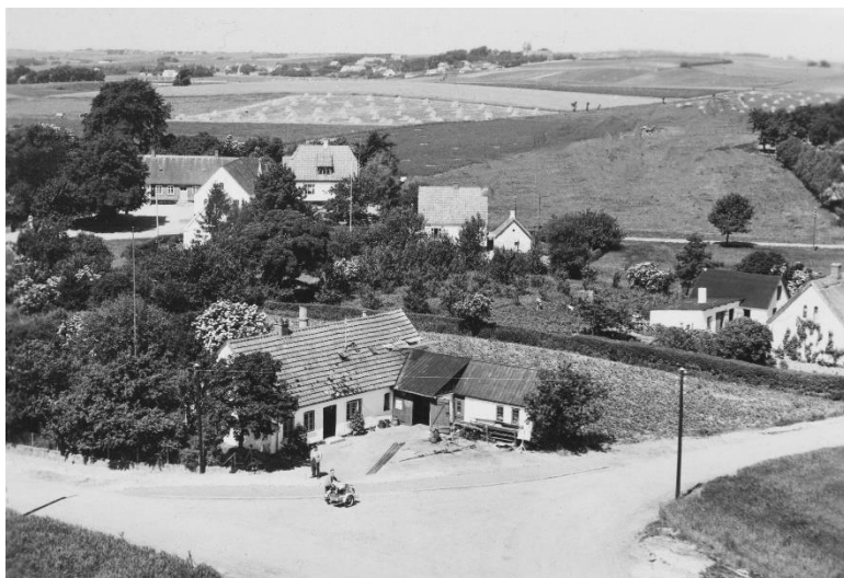
Ørby Smedje 1953

I Ørby var der også en systue, som i mange år syede tøj til nogle firmaer i København. Systuen gav arbejde til lokalbefolkningen. Systuer har der være flere steder i vores lokalområde, f.eks. Nejlunge, Nellerød og altså også i Ørby.