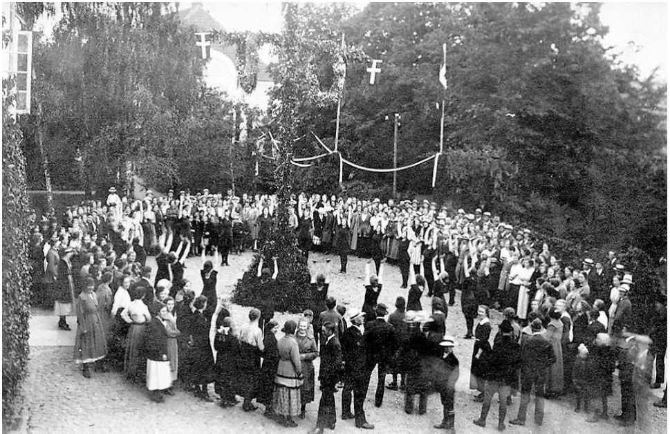
Pinsefest på Ørby Bavn 1957

På toppen af bavnehøjen står i dag en sten med påskriften: Sønderjylland 1920, til minde om Sønderjyllands genforening med Danmark. Skiltet på lågen til Ørby Bavn lover en flot udsigt fra toppen, men mod øst, vest og syd er udsigten begrænset af store træer og høj bevoksning, men mod nord er der en flot udsigt ind over Vejby og videre mod Vejby Strand.