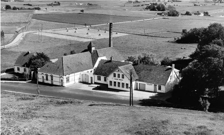
Ørekilde Mejeri 1956

Selve mejeriet lukkede helt ned i 1967, men bygningen blev bevaret og findes stadig, men er i dag ombygget til lejligheder, og bygningen kaldes i dag "Det Gamle Mejeri"