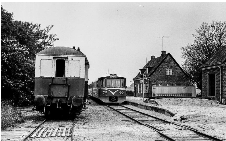
Ørby Station 1971

Ørby Bavn: En bavn eller en bavnehøj er et højtliggende sted hvorfra et brændende bål kan ses vidt omkring. Bavnen blev brugt som advarsel til naboerne om udefrakommende farer. Ørby har sin egen bavnehøj, som i daglig tale kaldes Ørby Bavn. Ørby Bavn har i mange år været helt tilgroet, men for år tilbage begyndte det daværende Frederiksborg Amt at rydde