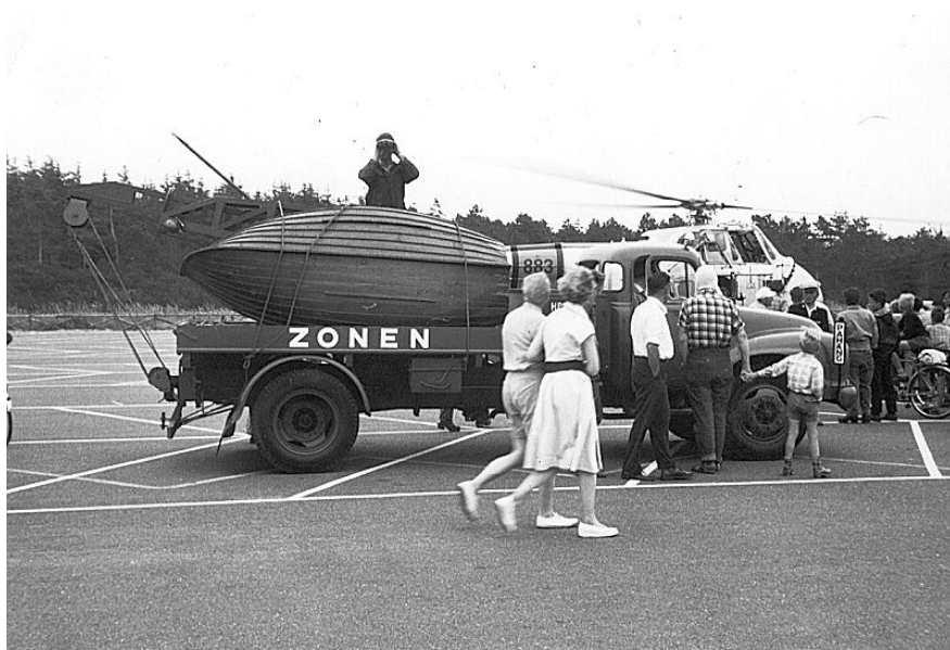
Denne jolle blev brugt ved redningen af de to tyske drenge. Billedet er taget ved en anden begivenhed.

med ambulance og kranbil, hvorpå der var placeret stationens lille træjolle.