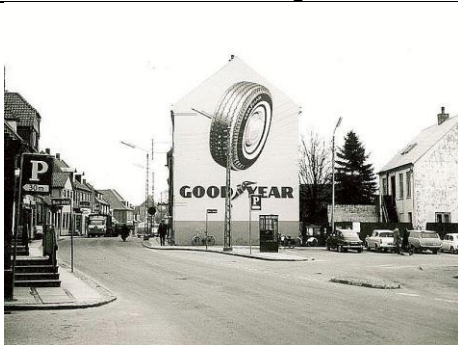
Østergade 8-10 ca. 1964