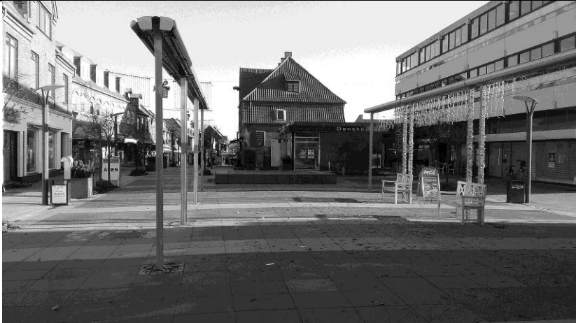
Østergade 8-10 i 2018