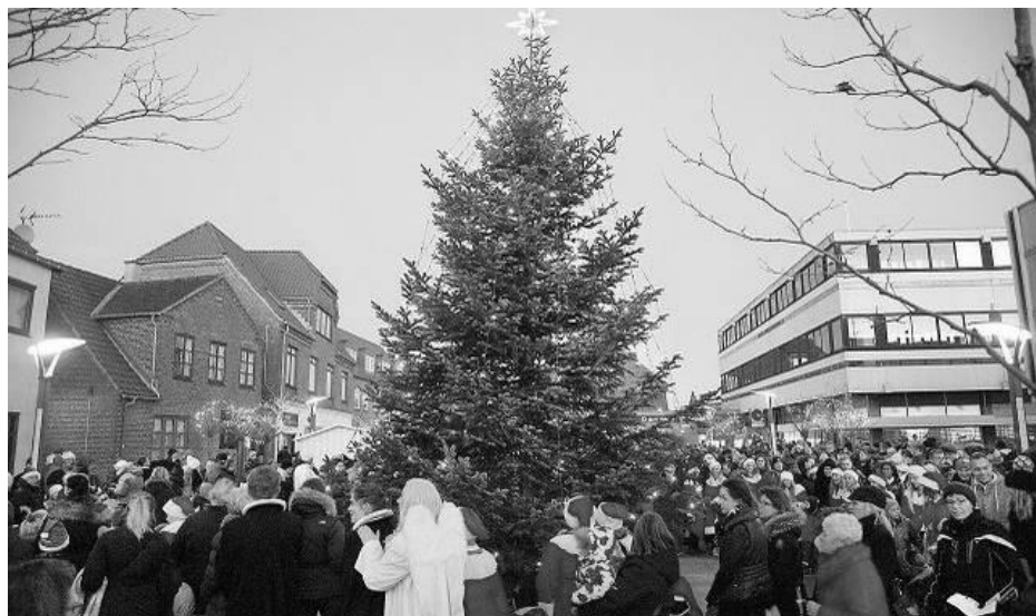
Juletræet i Østergade i Helsinge