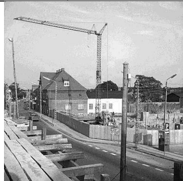
Østergade 8-10 ca. 1975