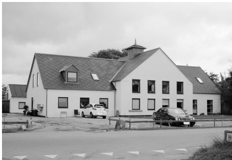
2019 - Skærød Mejeri