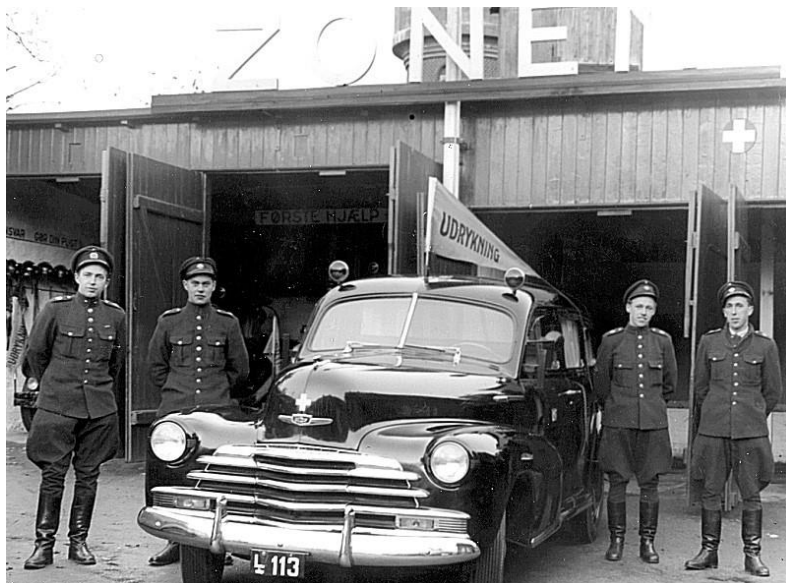
1950-Chevrolet Stylemaster

I Zone-Brandvagtens første år i Helsingø rådede man kun over en automobilsprøjte, men efter ZR blev dannet omkring 1930 blev brandvagten en brand- og redningsstation, idet en kranvogn kom til. Denne kranvogn var også forsynet med pumpe, så den kunne bruges som sprøjte. Der skulle gå omkring 20 år, inden Helsingø fik sin første ambulance, hvilket skete den 1. oktober 1950.