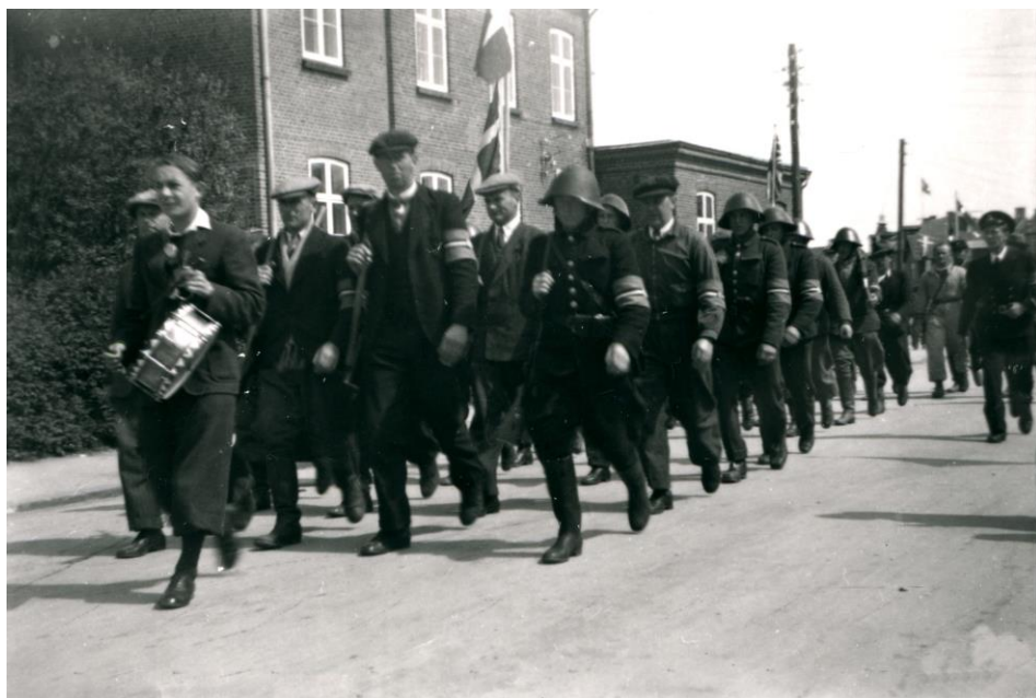
1945: Modstandsfolk ved Tinghuset i Helsingø