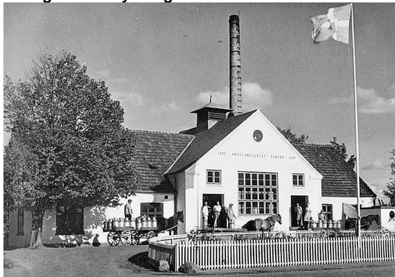
Skærød Mejeri - Årstal ukendt