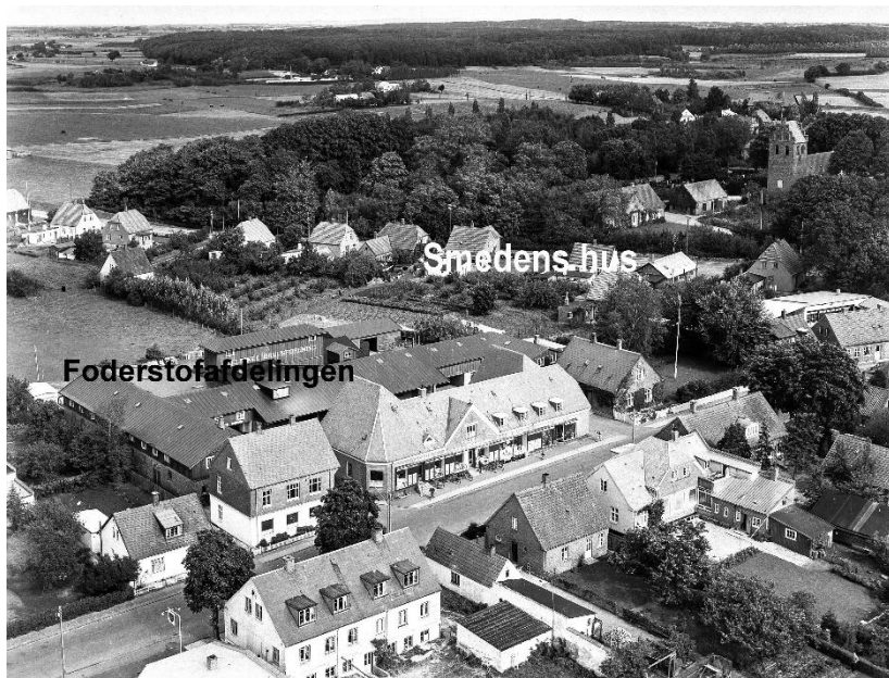
1953: Brugsen med foderstofafdelingen – Th. i baggrunden ses smedjen.