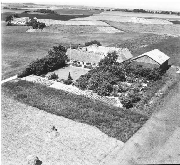
1956: Boagergård