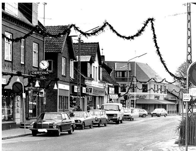
Ca. 1978-Vestergade set fra Østergade 1