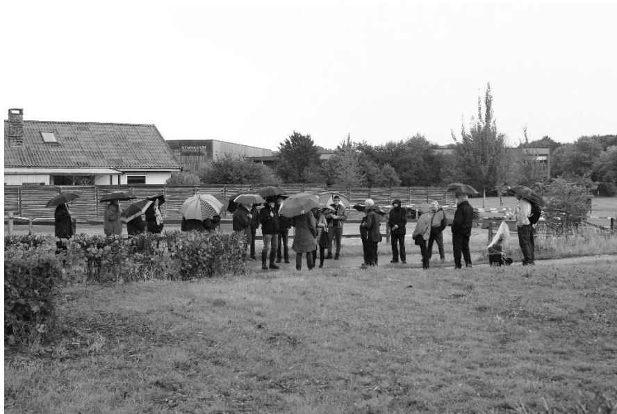
Foto fra Forenings byvandring omkring Helsinge Station og Østergade den 18. september 2022.