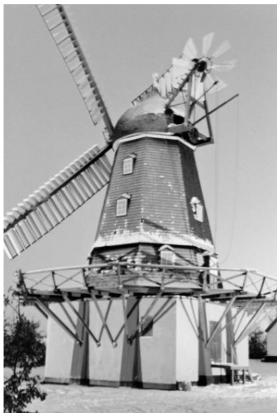
Ramløse mølle med sne og julebelysning

Nytårsaften spiste vi hos Bedste, det var altid kogt klipfisk med sennepssovs og sigtebrød med smør, rigtig lækkert. Nu var julen ved at være ovre, dog blev juletræet stående til Hellig tre Konger.