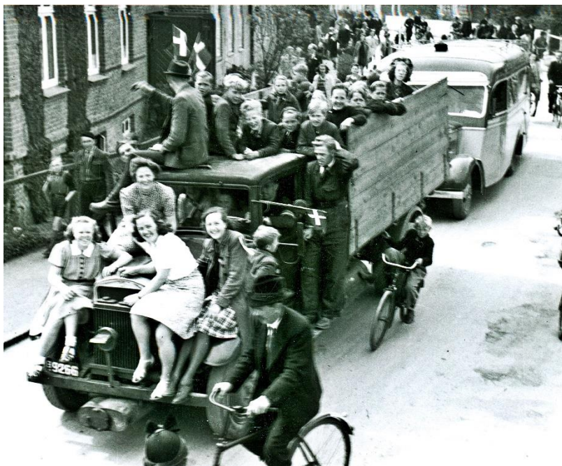
Glade borgere i Helsingø ved befrielsen maj 1945