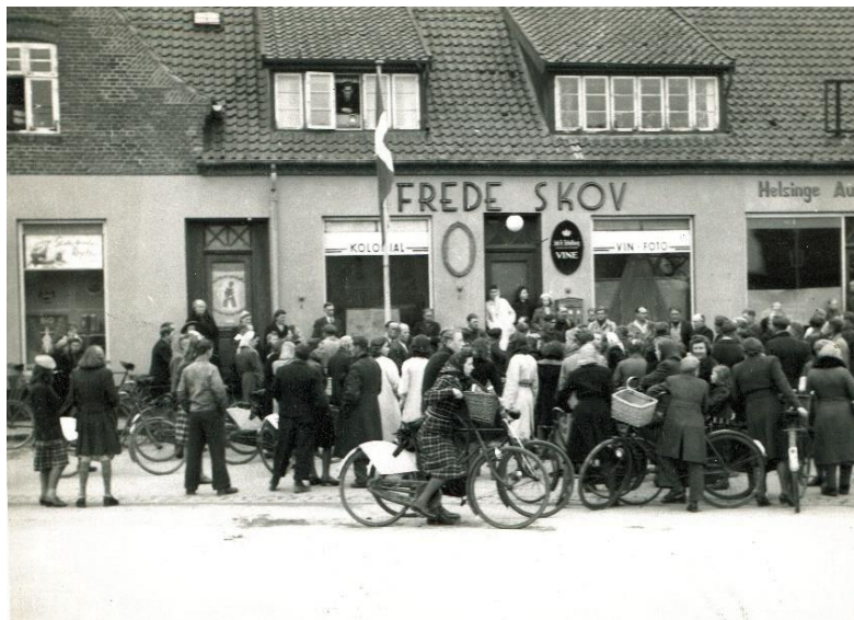
Vestergade 7, Torvet, Helsingør – Ved befrielsen maj 1945

riksborgvej den aften, Men senere kørte der nogle bevæbnede motorcyklister frem og tilbage. Det var patrioter, men nu kom ordet frihedskæmper i brug i stedet.