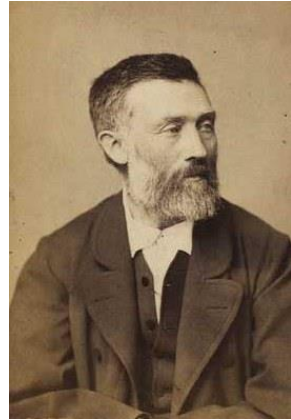
Den ældre P.C. Skovgaard

P.C. Skovgaard fik tre børn, sønnerne Joakim og Niels og datteren Susette. Alle tre børn fulgte i P.C. Skovgaards fodspor og blev kunstnere. Sønnen Joakim fik i 1901 en opgave med at udsmykke Viborg Domkirke, og dette arbejde var Viborg Kommune så begejstret for, at byrådet sammen med familien Skovgaard valgte at stifte et museum for familien. Dette kom til verden i 1937 i kommunens gamle rådhus ved siden af Viborg Domkirke. Først blev museet fyldt med familiens værker, der blev lånt til museet, senere er en del af værkerne blevet doneret til museet, der nu rummer en samling af fem generationer af familien Skovgaard, samt en lang række værker fra familiens venner og bekendte i kunstnerkredse, hvoriblandt er mange kendte navne. Hvis man kommer på Viborgeggen, kan jeg varmt anbefale et besøg både på dette museum og i Viborg Domkirke, som er udsmykket af sønnen Joakim Skovgaard.