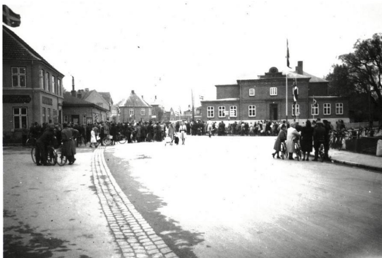
Glæde over befrielsen maj 1945 ved Tinghuset i Helsingør

Om morgenen den 5. maj ringede alle landets kirkeklokker af glæde en time, vist fra k. 8. Det var meddelt forud i radioen, at de ville ringe. Og alle, som havde flag og flagstang, havde hejst flaget. Over for Tinghuset have en del mennesker samlet sig, og da vi børn havde været hjemme med skoletasken, sluttede vi os til.