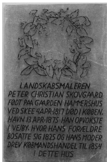
Mindetavle for P.C. Skovgaard

LANDSKABSMALEREN PETER CHRISTIAN SKOV- GAARD FØDT PÅ GÅRDEN HAMMERSHUS VED SKEE 4. APRIL 1817 DØD I KØBEN- HAVN 13. APRIL 1875. HAN OPVOKSTE I VEJBY, HVOR HANS FORÆLDRE BOSATTE SIG I 1825 OG HANS MODER DREV KØBMANDSHANDEL TIL 1854 I DETTE HUS