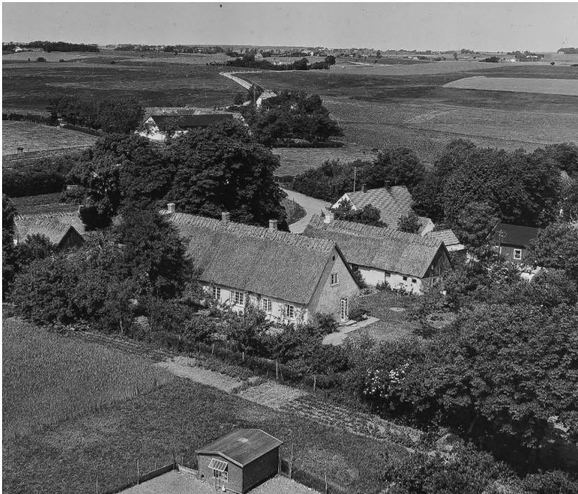
1956: Salekildevej 16 - Den tidligere Rytterskole

Rytterskole indtil 1912, bygningen findes stadig og anvendes til privatbolig.