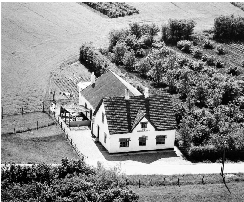
Forsamlingshuset 1956

I løbet af tiden er der også sket en del forbedringer på huset, bl.a. toiletforhold. I 1965 blev en større ombygning påbegyndt, en stor del af arbejdet blev udført af byens indbyggere som frivilligt arbejde, hvilket gav anledning til, at der i 1966 kunne holdes en stor fest i forbindelse med husets genindvielse, hvortil der blev skrevet en lejlighedssang, der nævner en del af de frivillige i teksten.