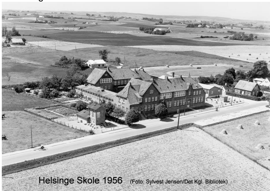
Helsinge Skole 1956

Fra Nygade, hvor vi boede i nr. 27, gik man ad skolestien, som gik gennem præstegårdsforpagterens marker over til Skolegade. Stien begyndte, hvor Nygade og Kirkegade mødtes. Stien var grusbelagt. Man kunne cykle på den, men vi skolebørn, som boede i Helsinge by, måtte ikke cykle til skole. Der var ikke cykelstativer nok på skolen til alle, som gerne ville cykle. Altså måtte vi gå til fods.