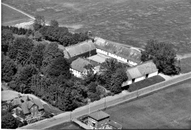
Kongensgade 1946

nogen tid, da der først skulle udarbejdes tegninger og ikke mindst skaffes økonomiske midler til at bygge for. Der gik flere år med at lave tegningerne og at skaffe pengene, men i 1856 var tiderne blevet bedre, og priserne gjorde, at det blev muligt at påbegynde at bygge et tinghus i Helsingør. Byggeriet blev startet i 1857 og i juni 1858 stod tinghuset i Helsingør klar til at blive taget i brug. Den 8. juni 1858 blev det første retsmøde afholdt i den nye bygning i Helsingør.