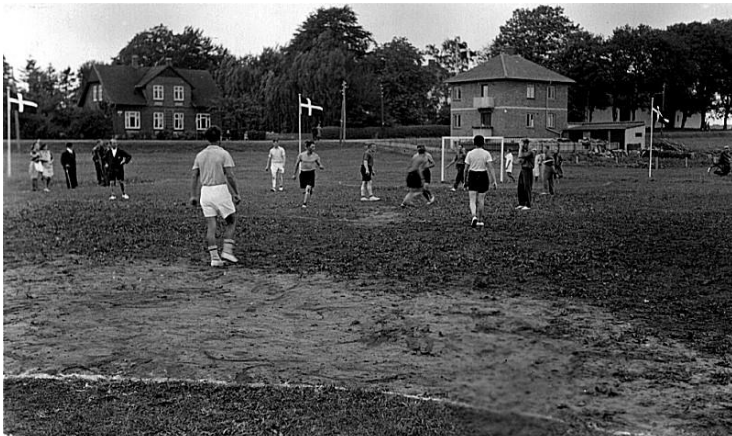
1940-FASG & I på Bøgelunds mark, Østergade. Helsinges