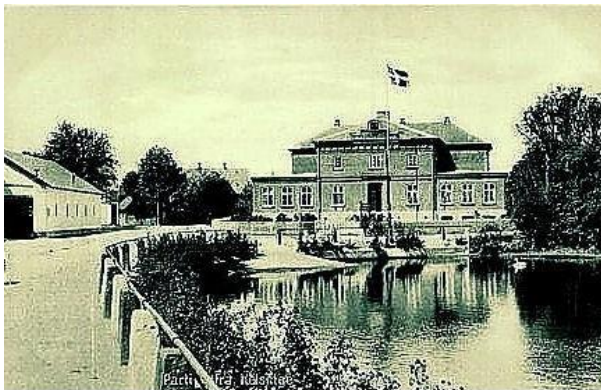
Tinghuset Helsinge - Postkort ca. 1920

Uddrag og fakta er hentet fra bogen "Kronborg Vestre Birk", skrevet i anledning af 100-års jubilæum for Tinghuset i Helsinge.