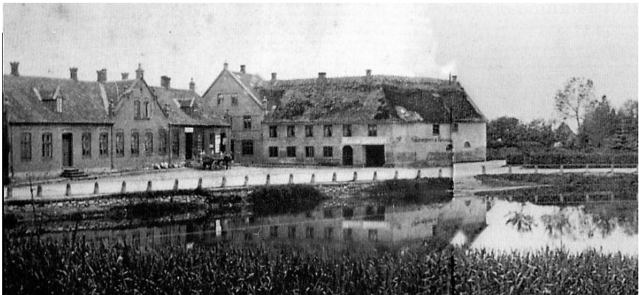
Toglerupgård, Helsingø Kro og Gadekæret

Facebook: Lokalhistorisk Forening Helsingø Omegn