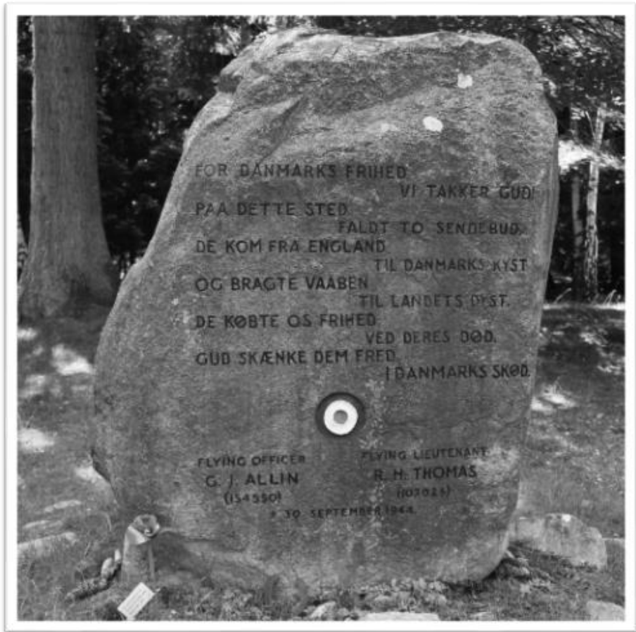
Flyverstenen 2018

September 1944, 2. verdenskrig sætter sit præg overalt, også i Mårum. Et mosquito jagerbombefly fra Royal Canadian Air Force er på togt over Danmark med to engelske piloter ombord: