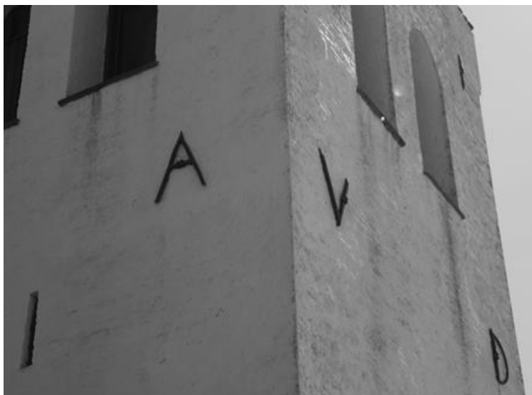
Nord- og Vestside på Annisse Kirke

På tårnet på Annisse Kirke ses på nordsiden bogstavet A og på vestsiden bogstaverne V og D. Der er to versioner om, hvorfor disse bogstaver er der.