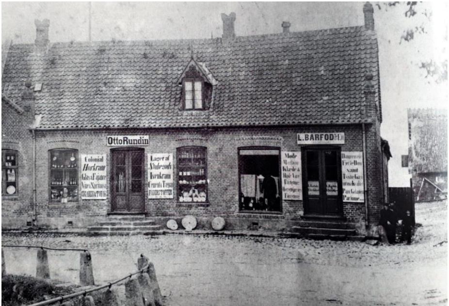
Vestergade 7, Helsingør