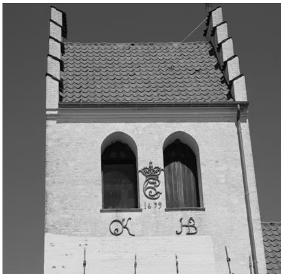
Sydsiden af tårnet på Annisse Kirke