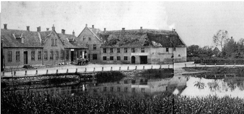
Toglerupgård, Helsingør Kro og Gadekæret