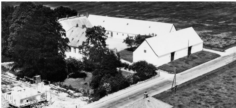
Kongensgave 1953

Johan Jørgen havde mange ideer, bl.a. ville han indrette en moderne hestemølle på gården, i gårdens smedje producerede han en "svingplov", som han fik 5 års eneret på at producere og sælge, men den store økonomiske succes udeblev.