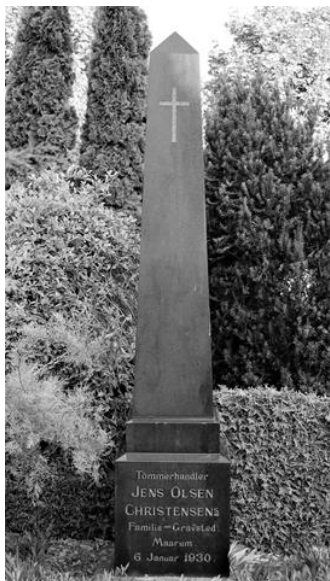
Kulfandens obelisk på Mårum Kirkegård