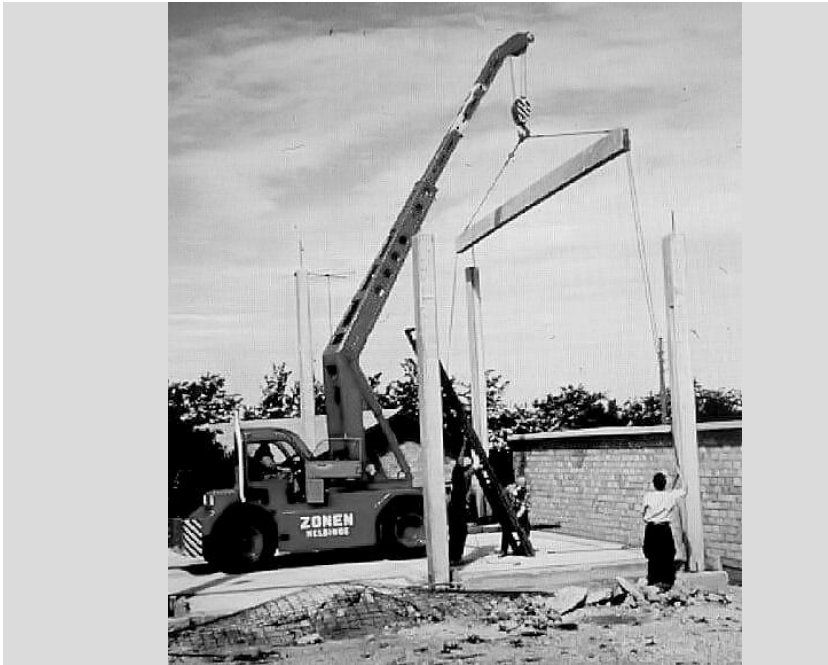
Mobilkranen på arbejde.

Entreprise dækker bl.a. over pumpeopgaver og flytning, opstilling og nedtagning af store og tunge emner, og til dette havde ZR Helsingør flere pumper, bl.a. en stor amerikansk Gorman-Rupp pumpe med en ydelse på 7000 liter/pr. minut (pumpen kan ses på Danmarks Tekniske Museum). Endvidere en mobilkran af mærket Demac.